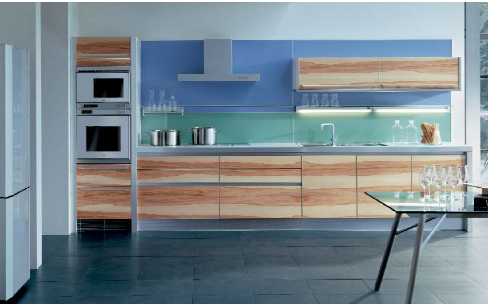
Designsprache von Coop Himm(l)au. Für Menschen mit dem Blick für das Wesentliche. Und: Art meets function - die neue Küchengeneration!

Eine ergonomisch geplante Küche besteht aber nicht nur aus verschiedenen hohen Arbeitsflächen. Dazu gehören z.B. auch