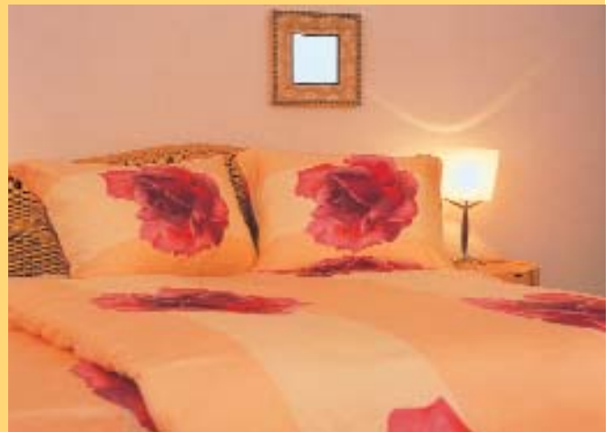
„Die Schöne, die über die Hügel kam“ - Bettwäsche „nabea“ von Hefel aus Micro-Lyocell in wunderschönen Farben und Mustern!

Komfort - hervorragende Knittererholung, bügelfreie Ausrüstung, Natürlichkeit und Atmungsaktivität verführt die neue Bettwäsche aber auch mit einer herausragenden Optik: Von klassischen Linien in Weiß und Champagner in reduzierten Dessins, über zarte florale Varianten in Orange, Gelb, Blau und Fuchsia bis hin zu grafisch betonten, strengen Mustern in Gelb und Flieder.