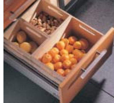
Laden geben jedem Aufbewahrungsgut festen Stand und schaffen Übersicht.

Backofen und Kühlschrank in bequemer Sicht- und Griffhöhe, um lästiges Bücken zu ersparen. Wir bevorzugen Küchen mit vielen Auszügen statt der statisch angeordneten Fachböden in den Unterschränken. So ist eine gute Übersichtlichkeit gewährleistet und - ganz wichtig - alles kann rückschonend nach oben entnommen werden. Schließlich sollten die unterschiedlichen Arbeitsbereiche so nebeneinander angeordnet sein, dass von einem zum anderen nur noch kurze Wege notwendig sind.