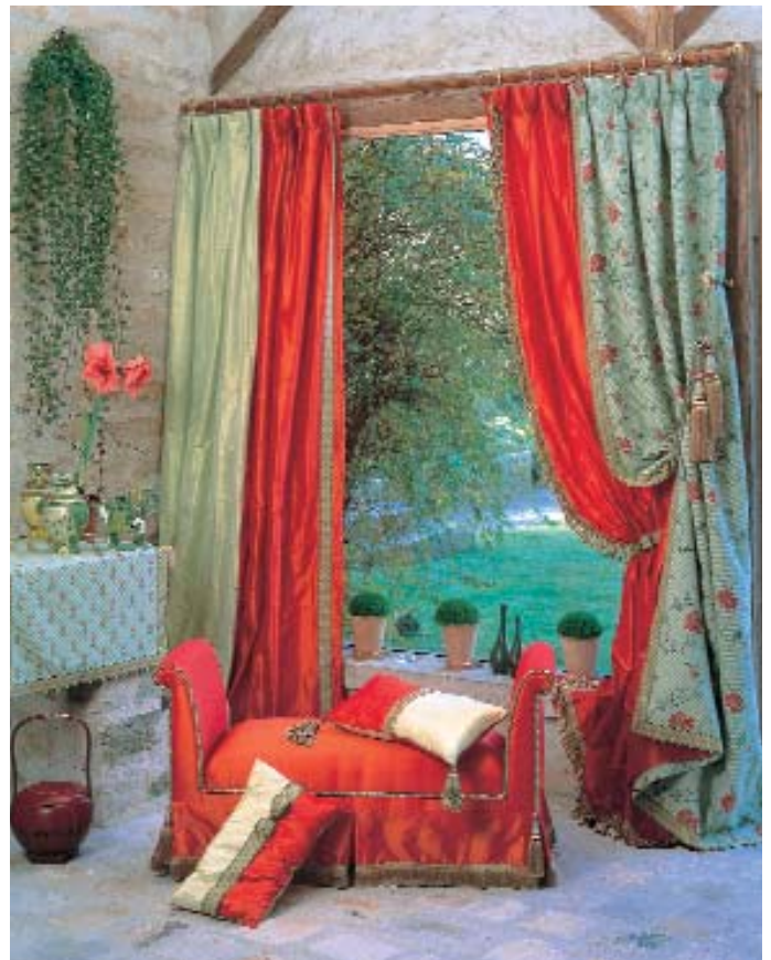
Ein Ausschnitt aus den aktuellen Kollektionen „Malherbes“ und „Arthur“ von Houllès.

Trendfarben im engeren Sinne gibt es eigentlich nicht. Bei den Stoffen dominiert weiterhin Uni. Neben Creme-, Braun- und Grautönen werden Rot- und Blautöne vorgestellt. Beliebt sind warme Naturfarben sowie Grün. Bei Vorhangstoffen und Polstermöbeln geht es dezent zu. Flauschiger Flanell oder leicht changierende, gemusterte Dessins, teilweise mit Applikationen oder gesteppt. Velours-Chenille-Kombinationen sind vielfach zu