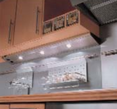
Der Oberschrank gewährt Kopffreiheit und leuchtet den Spülbereich punktgenau aus.