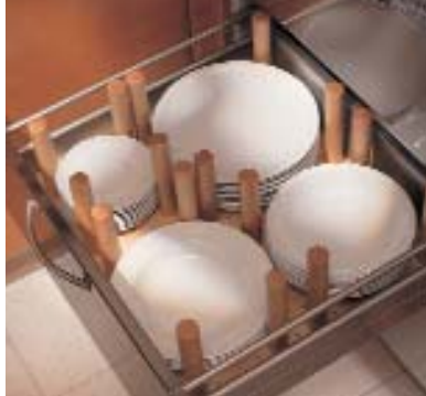
Höchste Funktion: Technik, Möbel und Ausstattungselemente ergänzen einander.