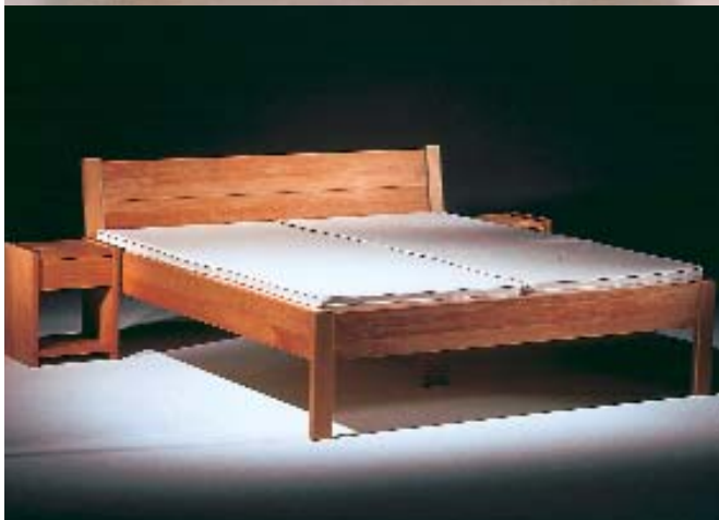
Wie man beim Schlafen Gutes für den Rücken tun kann, beweist das Naturbetten-System von Hüsler Nest.