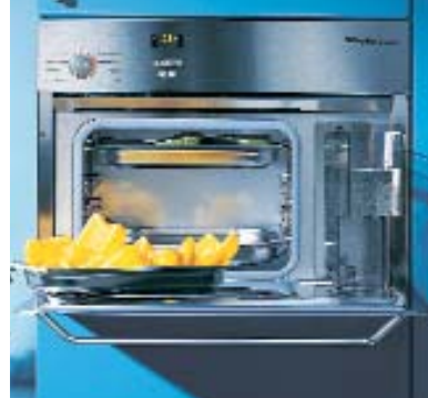
Erlaubt die Bedienung in ergonomischer Höhe: der Edelstahl-Dampfgarer von Miele.